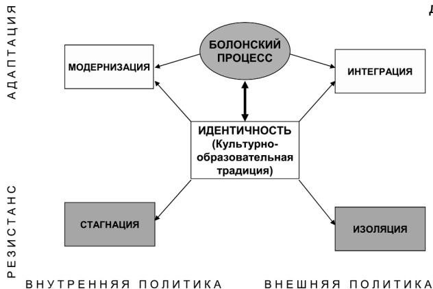
Рис.3. Альтернативы для России