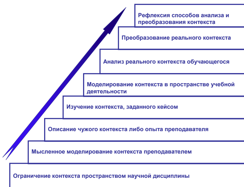
Рис. 2. Уровни включенности контекста в образовательную деятельность

онного натиска” у части людей размывается адекватное восприятие реальности. Реальность подменяется сиюминутностью