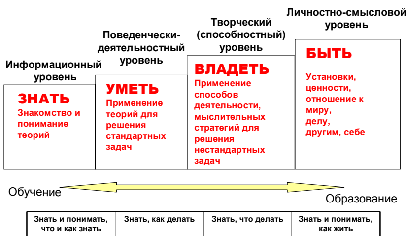
Рис. 1. Идея развития компетентности

Данные уровни (рис. 1) соответствуют продвижению обучающегося по ступеням: от знания через понимание к творческой деятельности и к развитию универсальных способностей личности, т.е. от получения первых научных представлений до создания индивидуального образовательного продукта.