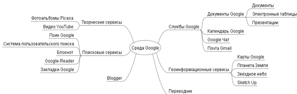
Рис. Таксономия сервисов в среде Google

ния и письма. Образцы этой литературы публикуются в сети Интернет, чтобы и взрослые и дети могли бы читать, играть с ними, классифицировать, обсуждать и кри-